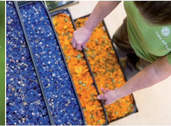
> Le séchage des fleurs. Ici le bleuet et le calendula.