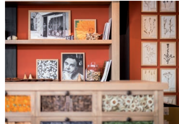
> À l'entrée de la Maison Yves Rocher, trône le portrait du fondateur.

Le jeune Yves Rocher grandit au sein de la boutique familiale de fabrication de chapeaux et de confection de textile. Ici règne un univers de mode et de beauté, loin des frous-frous de la capitale. Malheureusement, le bonheur familial est de courte durée. A la fin de la Seconde Guerre Mondiale, en 1944, Yves Rocher devient le chef