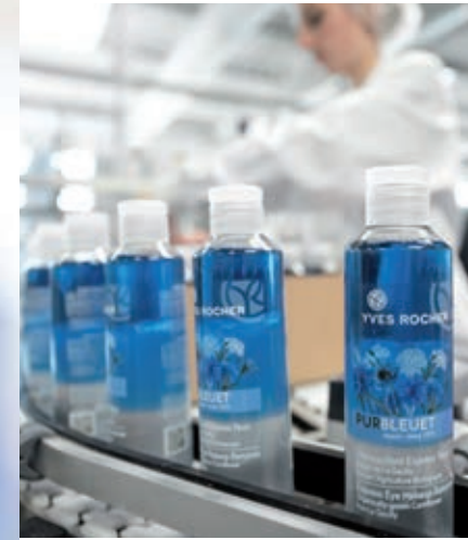
> Des produits de soin et de maquillage en fabrication dans les usines bretonnes Yves Rocher.

« Avoir découvert les propriétés des plantes n'est pas notre plus grand mérite. Les avoir mises à disposition de tous est notre fierté. » Monsieur Yves Rocher