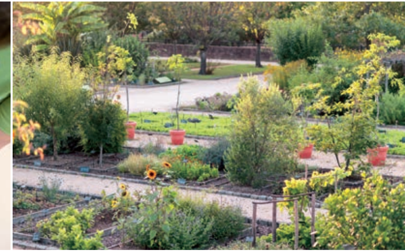
> Le Jardin Botanique recense plus de 1.500 espèces végétales, parmi lesquelles de nombreuses espèces menacées ou en voie d'extinction.

Ainsi, la Manne de Frêne, récoltée en Sicile, participe au maintien d'un patrimoine local. Autre exemple à Madagascar, Yves Rocher a mis en place une filière d'approvisionnement de l'Aphloïa, plante qui révèle une double action anti-pollution et réparation. Au total, Yves Rocher compte aujourd'hui plus de 250 filières végétales dans le monde.