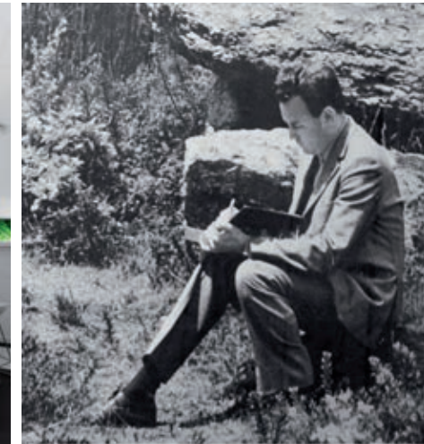
> Monsieur Yves Rocher travaillant dans la nature, dans les années 60.

de famille après la mort de son père. Il n'a que 14 ans. Après ce décès brutal, il trouve refuge dans les bois. C'est là, au cœur de la nature, que le jeune homme retrouvera son équilibre et approfondira sa connaissance du monde végétal, initié par son père durant son enfance.