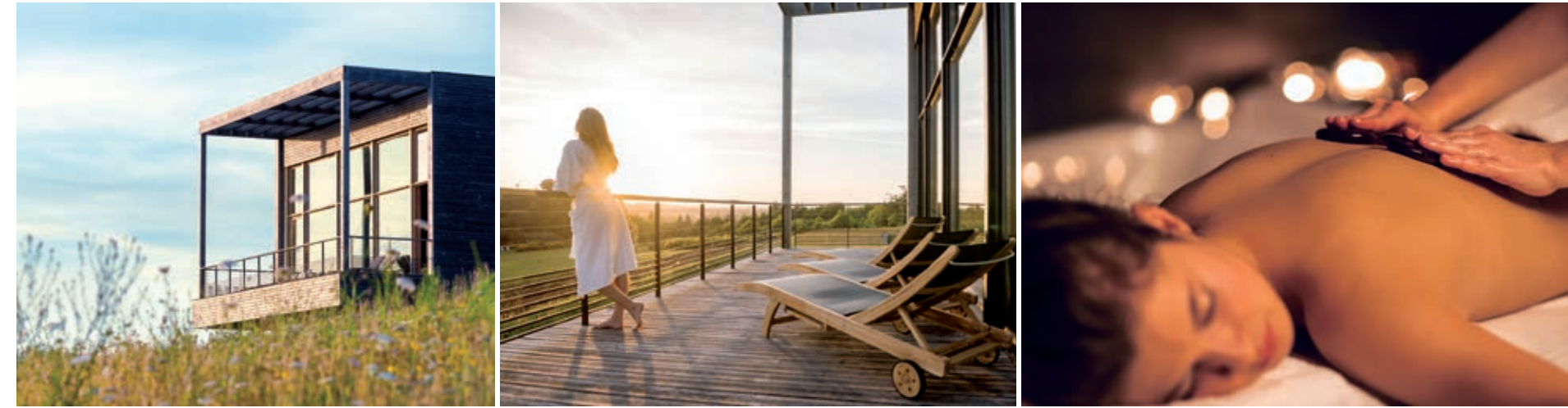
> L'éco-hôtel spa La Grée des Landes, véritable îlot de bien-être au cœur de la nature gacillyenne, offre une expérience inédite.

Pour poursuivre encore davantage cette stratégie