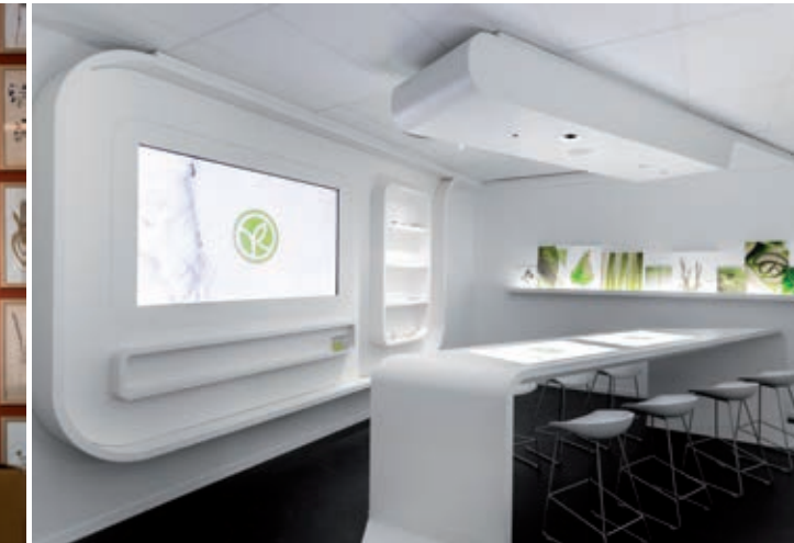
> Les coulisses de la Cosmétique Végétale®, une des cinq salles de la Scénographie Yves Rocher.