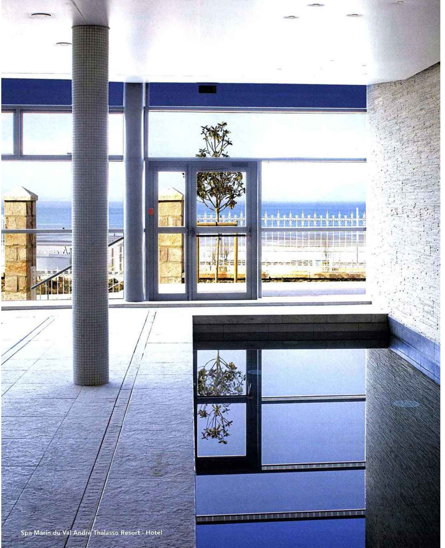
Spa Marin du Val André Thalasso Resort - Hotel