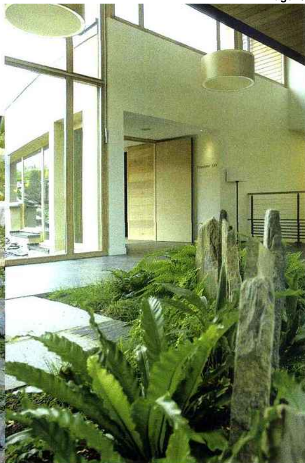
Pierre bleue et végétaux cohabitent, pour apporter une touche de nature à l'intérieur.

la mini station d'épuration naturelle : un bassin autonome drainant, planté de roseaux à balais, traite les matières organiques, les racines des plantes servant à maintenir une perméabilité homogène et à créer une rhizosphère propice au développement bactérien. La récupération des eaux de pluie, quant à elle, n'est pas oubliée : s'écoulant depuis les toits, l'eau est stockée dans un bassin à orage et assure ainsi l'arrosage des jardins et du potager ainsi que l'entretien des terrasses. Près de 85 000 litres d'eau sont ainsi