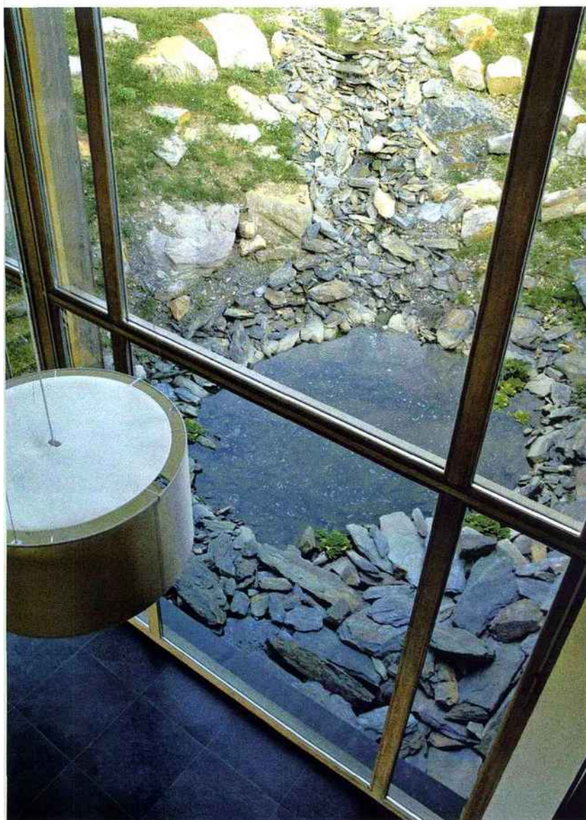
A La Grée des Landes, la lumière naturelle et la chaleur du soleil sont les bienvenus... Les amples baies vitrées sont évidemment exposées sud.

elle est dé-chlorée par un système de filtration naturel avant d'être réinjectée grâce à un ingénieux double circuit pour les chasses d'eau des chambres. Rien ne se perd, tout se transforme ! Pour les douches, l'économie de l'eau est de mise, grâce à l'éco-douchette à mousseur intégré limitant le débit de l'eau à 12 litres par minute contre les 20 habituels. Son secret ? Elle mêle tout simplement de l'air à l'eau et permet ainsi de ne pas réduire la pression ni le confort du jet. Pour le traitement des eaux usées, place à