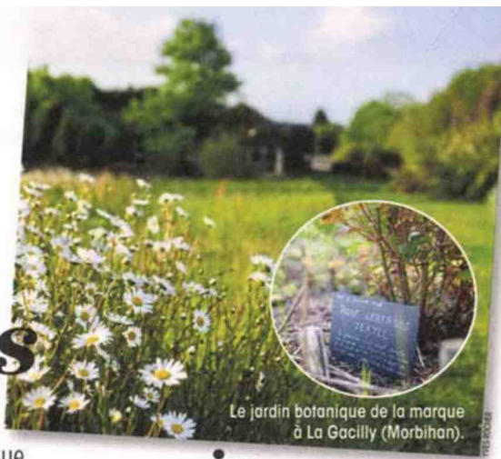
Le jardin botanique de la marque à La Gacilly (Morbihan).

Lorsqu'il met au point sa première crème, le jeune Yves Rocher ne se doute pas qu'il s'apprête à lancer l'un des fleurons de la cosmétique française. La marque qui porte son nom fête ses 60 ans. SARAH PETITBON