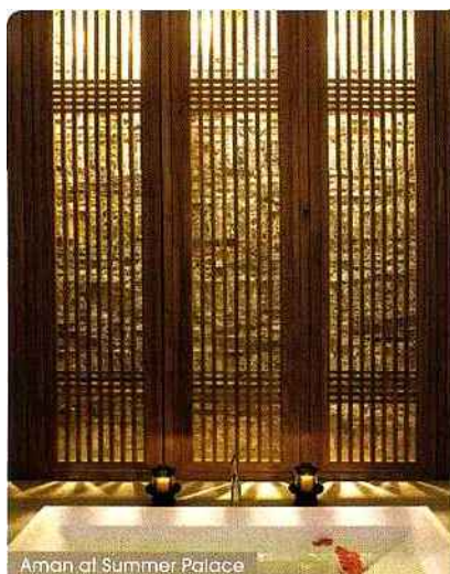
Aman at Summer Palace