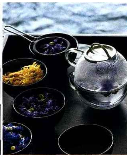
La Grée des Landes Eco Hotel Spa Yves Rocher

www.etangs-corot.com Gommage crushed Carbernet, 35 mn : 80 €. Soins du visage Vinosource, 50 mn : 100 €.