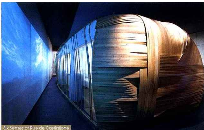
Six Senses at Rue de Castiglione